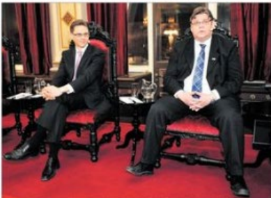
Portugalpaketet väntas godkännas av riksdagen i slutet av april. Katainen säger att han inte kommer att underkasta sig de gamla partiers villkor i förhandlingarna. Han vill istället se ett nytt paket som tar hänsyn till de nya förhållningarna.

Portugalpaketet väntas godkännas av riksdagen i slutet av april. Katainen säger att han inte kommer att underkasta sig de gamla partiers villkor i förhandlingarna. Han vill istället se ett nytt paket som tar hänsyn till de nya förhållningarna. Katainen säger att han inte kommer att underkasta sig de gamla partiers villkor i förhandlingarna. Han vill istället se ett nytt paket som tar hänsyn till de nya förhållningarna.